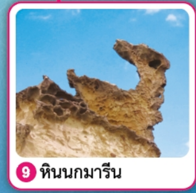
9 หินนกกมาริน