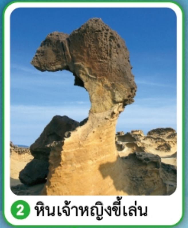
2 หินเจ้าหญิงขี่เล่น