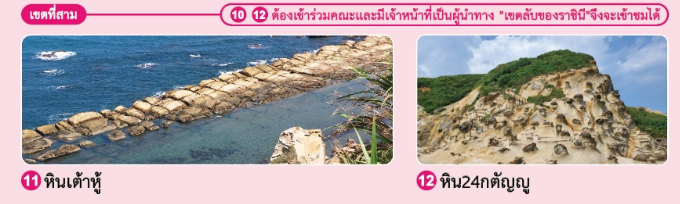
11 หินเต้าหู้