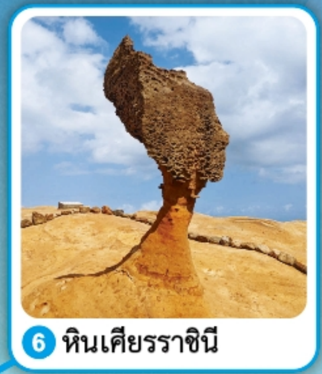
6 หินเคียรราชินี