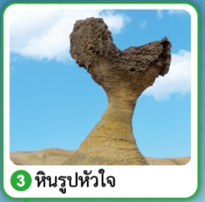
3 หินรูปหัวใจ