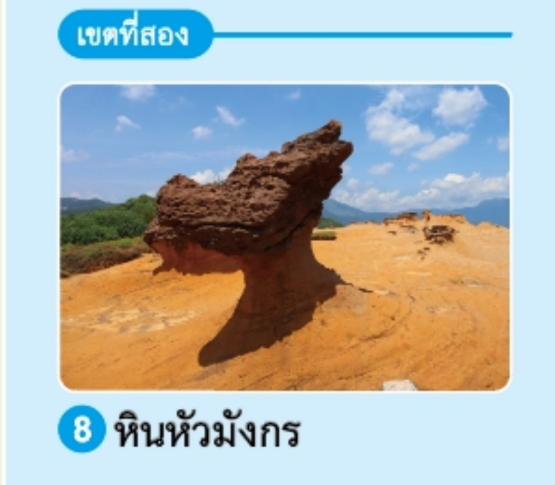
8 หินหัวมังกร