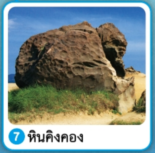
7 หินคิงคอง