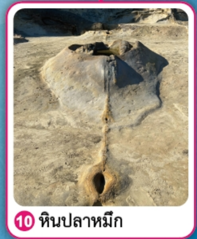
10 หินปลาหมึก