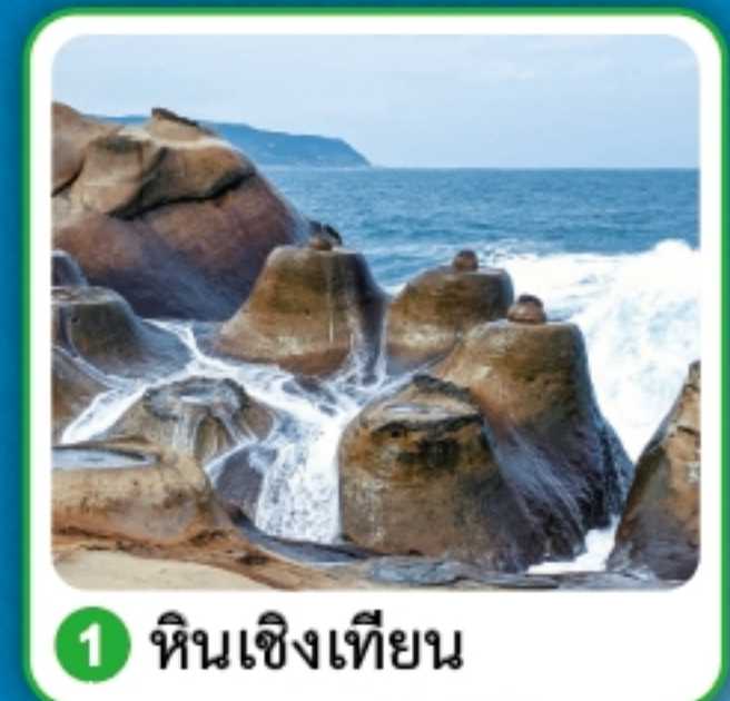
1 หินเชิงเทียน