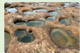
5 甌穴 (ポットホール)