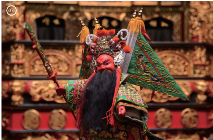
07 李天祿布袋戲文物館

MAP 2B 為已故布袋戲大師李天祿生前為保存與傳承布袋戲文化而設立。館內陳列大量木偶臉譜、服裝、演出樂器及珍貴腳本等，也有體驗區與感應式影音導覽。