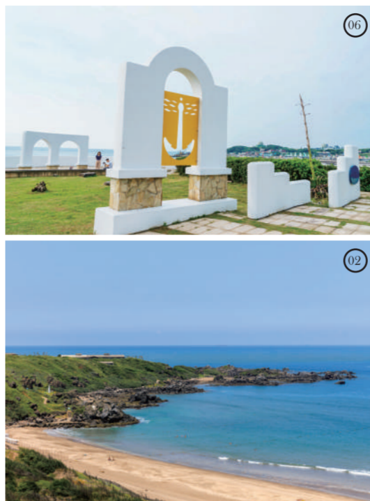
04 北海岸海灣探索館

MAP 2B 長約 1 公里、沙質潔淨且海水清澈的白沙灣，為位於麟山鼻與富貴角公園之間的半月型天然海灣，因豐富的水上活動成為夏日戲水勝地。